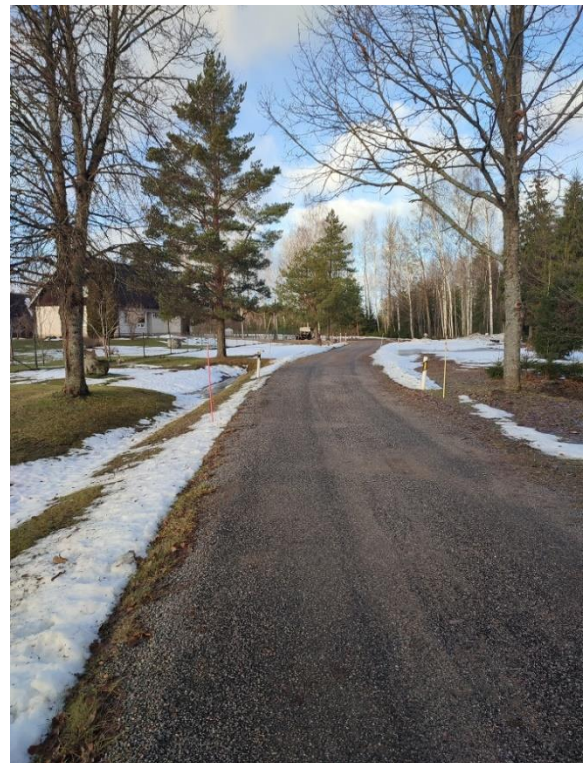
Foto 2 Vaade planeeringualale Meltsovi teelt