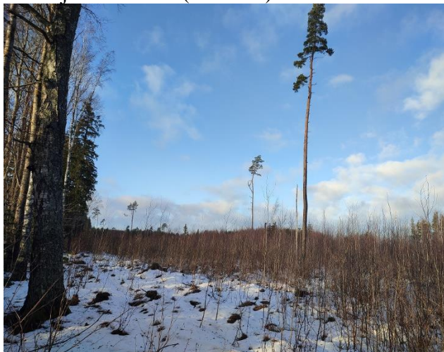
Foto 1 Vaade planeeringualale selle lõunapiirilt

Kivi katastriüksusele ei ulatu maakatastrisse kantud kitsendused. Maaüksust läbivad kuivenduskraavid. Maa-ameti kõlvikukaardi alusel on Kivi katastriüksuse 2,52 ha suurusest kogupindalast 2,43 ha metsamaa ning 0,09 ha muu maa (st kraavide alune maa). Maaüksusel on teostatud lageraie. Alal kasvavad üksikud seemnemännid, seemnekased on kuivanud. Valdav on haava ja kase võsa. (vt Fotod).