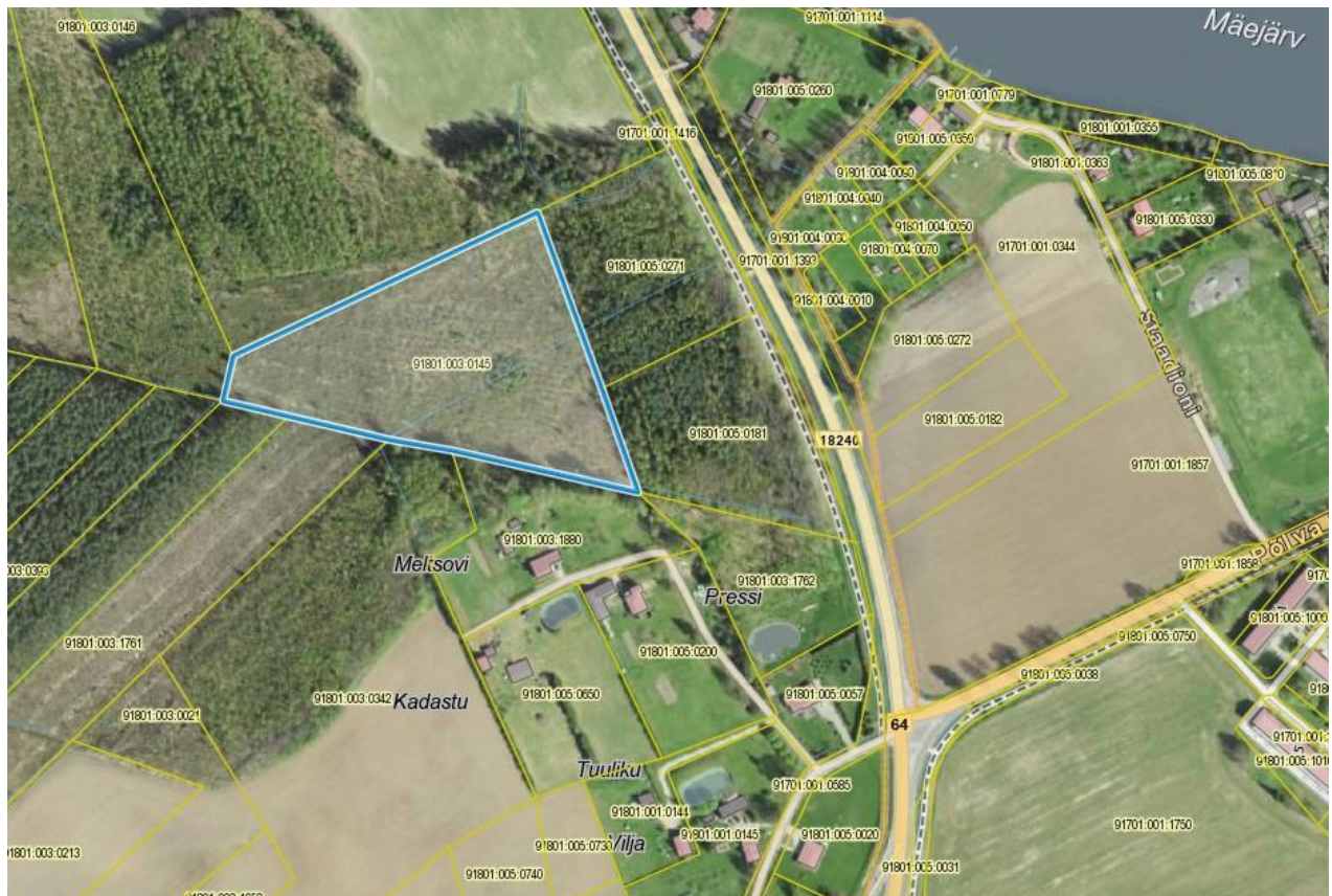
Kivi katastriüksuse asukoht Joonis 1 Detailplaneeringu ala. Aluskaart: X-GIS. Maa-amet.

Kivi katastriüksusele ei ulatu maakatastrisse kantud kitsendused. Maaüksust läbivad kuivenduskraavid. Maa-ameti kõlvikukaardi alusel on Kivi katastriüksuse 2,52 ha suurusest kogupindalast 2,43 ha metsamaa ning 0,09 ha muu maa (st kraavide alune maa). Maaüksusel on teostatud lageraie. Alal kasvavad üksikud seemnemännid, seemnekased on kuivanud. Valdav on haava ja kase võsa. (vt Fotod).